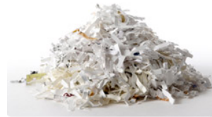
Morceaux de papier