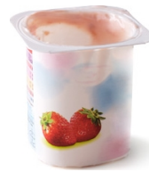
Pot de yaourt