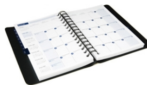
Cahier à spirales