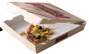
Cartons souillés: Pizzas, frites, hamburgers ...