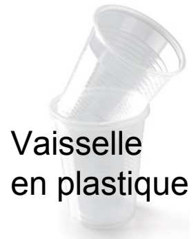
Vaisselle en plastique